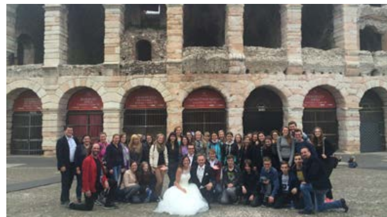
Projektový týden latiny a dějepisu. Verona, říjen 2015