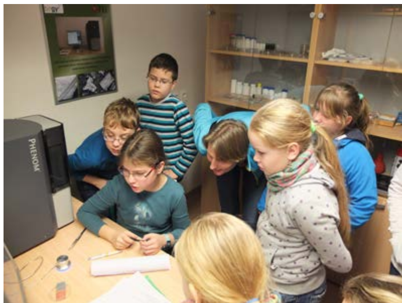
Sekundáni představují elektronovy mikroskop na Den otevřených dětí