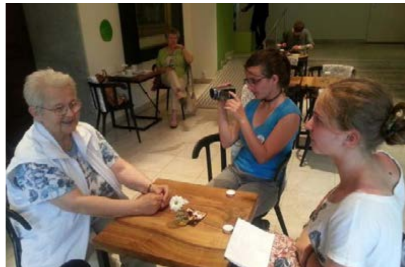
Pouť smíření – rozhovor s pamětnicí